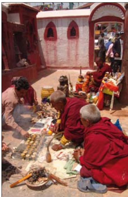
Abb.: Von buddhistischen Lamas werden in Boudhanath (Nepal) Rituale für Langlebigkeit und Wohlstand durchgeführt. Höhere Wege - wie zur Befreiung - finden im Volksglauben weniger Interesse.

Der Svastika- oder Yungdrung-Bön, der auch als „ewiger Bön“ bezeichnet wird, geht auf Tönpa Shenrab Miwoche zurück. Dieser erleuchtete Meister lebte vor ca. 18.000 Jahren im Lande Shang-Shung. Aus dem Lande Tazik kommend reformierte er die in Tibet herrschenden Bräuche, worauf in der Folge von Menschen- und Tieropfern Abstand genommen wurde. Tönpa Shenrab Miwoche führte meditative Praktiken ein, wodurch die Menschen die Ursprünge des „äußeren“ Animismus in ihrer eigenen Beseeltheit erfahren konnten. Lokalgöttheiten wurden in Meditationsgöttheiten oder Schützer des Bön-Weges umgewandelt. Diese Wesenheiten wurden von Shenrab Miwoche ähnlich wie später die Bön-Göttheiten von Padmasambhava