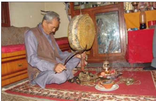
Abb.: Nepalesischer Jhankri beim Aufrufen seiner Ausrüstungsgegenstände. Links oben kann man noch seinen buddhistischen Altar etwas erkennen, auf dem auch ein Bild des Dalai Lama steht. Wie man hier mitbekommt, werden die verschiedenen Wege durchaus von einer Person praktiziert.

Heilen individueller Problemstellungen, im Segnen von Haus, Grundstücken und in Wohlstandsritualen. Die Heilkunst der Seelenrückholung steht für den Schamanen an erster Stelle, auch die Fähigkeit der Seelenbegleitung auf ihrem Weg nach dem Tode hat einen gleich hohen Stellenwert.