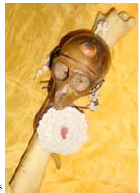
Magisches Saugrohr aus einem Hirschknochen, mit dem man Blockaden und andere schädliche Einflüsse aus dem Energie-Körper entfernt. Dieses schamanische Utensil wurde im Rahmen des Workshops Heilen im Medizinkreis von mir

Dieses Werkzeug wird eingesetzt, um den Energiekörper von Blockaden