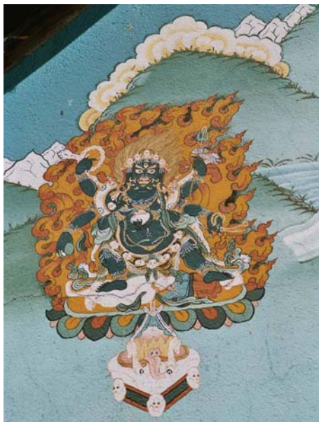
Abb.: Grimmiges Mitgefühl, zornvolle Erleuchtung. Mitgefühl und Befreiung sind nicht immer nur friedvoll, sondern können manchmal auch grimmig erscheinen. Dies ist dann wie der warnende Zeigefinger einer Mutter, wenn ihr Kind gerade im Begriff ist, mit seinen Fingern in eine Steckdose zu greifen.

Yamantaka - der Bezwinger des Todes - mit sechs Armen. Er ist eine grimmige Erscheinung des Erleuchtungsgeistes. Seine Arme stehen für die sechs Vollkommenheiten (paramitas). Mit seinem Tanz zerstört er die Unwissenheit.