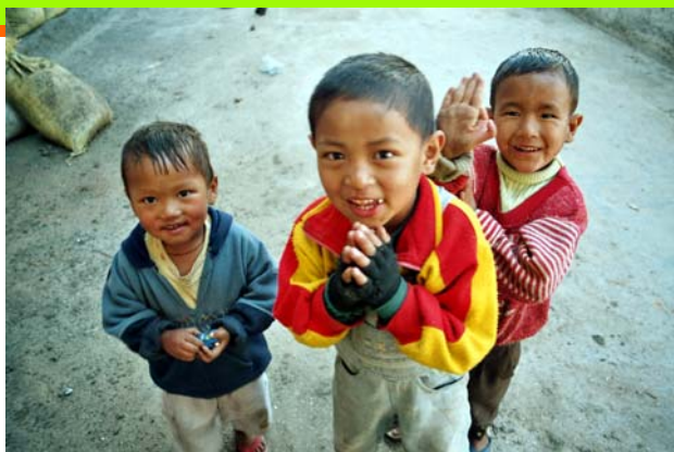
Abb.: Lachende Kinder sind das Sinnbild für Maitri (Pali: Metta) - Liebende Güte. Durch einen freundlichen Umgang mit sich selbst öffnet sich der Geist. Mit der Unbefangenheit und dem wachen Interesse eines Kindes kann man während der Meditation so alles einladen, Platz zu nehmen in seiner Welt. Nichts muss mehr ausgegrenzt und verdrängt werden.

Wie bei allen anderen Verweilungen beginnt man auch beim Entwickeln von Wohlwollender Freude zunächst einmal bei sich selbst. Oftmals gestattet man sich einfaches Erfreuen nicht, da man Freude über das eigene Mehrwertsein gegenüber anderen erfahren hat. Man reflektiert beispielsweise den Tag im Geiste und zählt zunächst einmal die Segnungen, die man an diesem Tag erfahren hat. Nach einiger Übungszeit – das können manchmal Tage oder sogar Wochen sein – entdeckt man, dass man eigentlich ganz schön viel Segen erlebt hat. Daraus wächst dann die selbstlose Freude am Wohlergehen und Glück anderer.