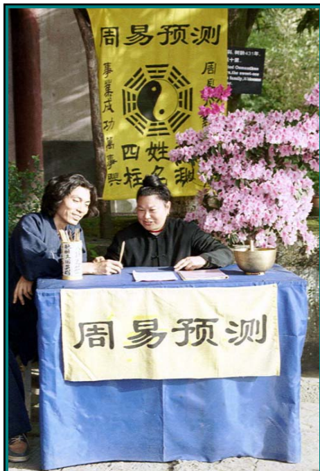
Abb.: Das Dao - die natürliche Ordnung der Dinge - kann man durch die Befragung eines Orakels ergründen.

Das Dao offenbart sich dem wahren Krieger in seiner eigenen Natürlichkeit. Diese Natürlichkeit zeigt sich in der Einheit des Seins, in der Bereitschaft zu empfangen, an dem Weg der Mühelosigkeit, im harmonischen Fluss der Lebensenergie, in innerer Würde, in Muße und im Vertrauen in sich selbst.