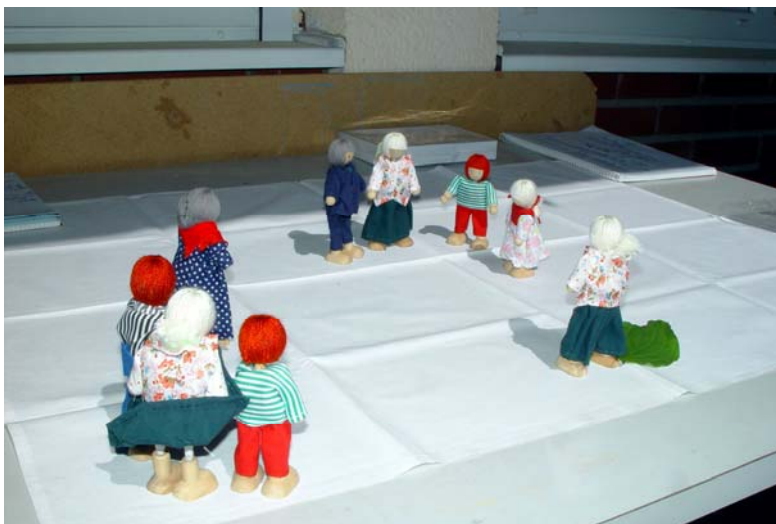
Abb.: Im System Familie stehen alle Familienmitglieder miteinander in Beziehung. Wird einem Mitglied sein Daseinsrecht nicht gewährt, dann füllt ein anderes Familienmitglied diesen Platz aus und übernimmt auch dessen Sippenauftrag.

Aus schamanischer Sicht gehen wir davon aus, dass unsere Identität nicht nur auf unsere genetischen Ahnen beschränkt bleiben kann. Wir müssen auch die Einflüsse aus der Entwicklungsgeschichte der nichtmenschlichen Reiche der Schöpfung sowie von allen Bereichen der Kunst, Politik, Wissenschaft und Kultur berücksichtigen. Sie alle formen an der Identität mit.