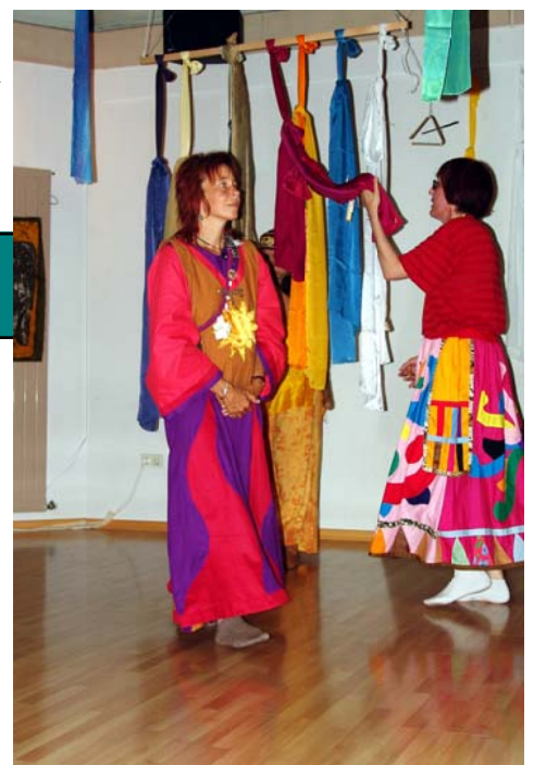
Abb.: Anrufung der Planetenkräfte während der Bellian-Zeremonie

Gemäß dem Prinzip der Leerheit von einem eigenständigen Selbst ist die Person ein Konglomerat aus Identifikationsbestandteilen. Über diese Bestandteile wirkt der