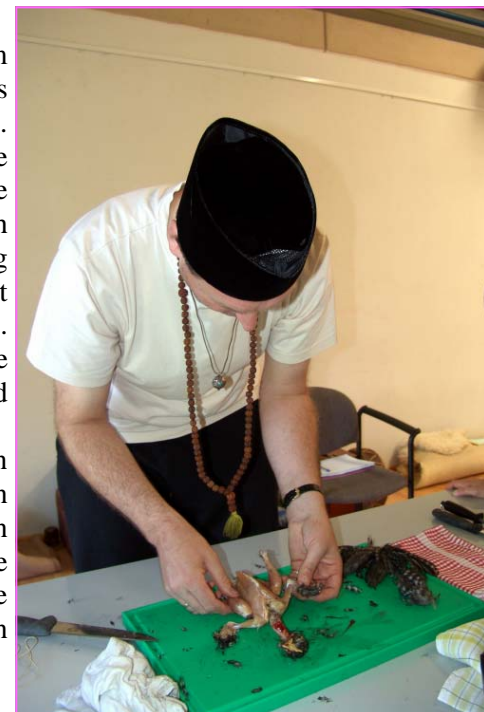
Abb.4: Zerteilung des Huhns - Nachdem die Information des Klienten auf das Huhn übertragen worden ist, wird es getötet und zerteilt. Dabei sieht man am Huhn, welche Störzonen am Klienten vorhanden waren. Mit einer Brühe, aus dem Huhn und Innereien hergestellt, erfolgt dann die Balancierung.

Die Klientin isst noch am Abend die Hühnersuppe, in der die mit Mantra aufgeladene Medizin der inneren Organe enthalten ist. Zusätzlich führt sie über mehrere Tage rituelle Waschungen mit Bestandteilen von Kräutern aus, die der individuellen Situation entsprechend zusammengestellt werden.