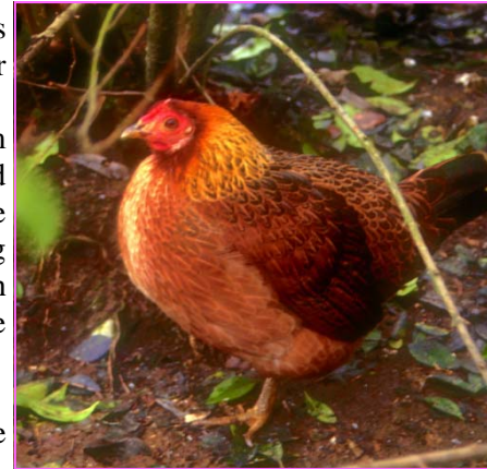
Abb. 1: Das Haushuhn ist eines der ältesten Haustiere der Menschheit