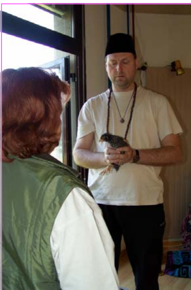
Abb. 3: Übertragung auf das Huhn

Die Klientin wird bereits während der Vorarbeiten ungeduldig und versucht oftmals und zunehmend vehement, selbst Abschnitte der Zerteilung zu übernehmen. Ihre Hände drängen förmlich ins Geschehen. Was mir zuerst als Übergriff erschien, wurde mir in der wirklichen Bedeutung als Teil des Rituals erst in der Reflexion bewusst: das zentrale Anliegen der Klientin, aus dem sie das Ritual unternehmen wollte, war „die Erlangung von Handlungsfähigkeit“.