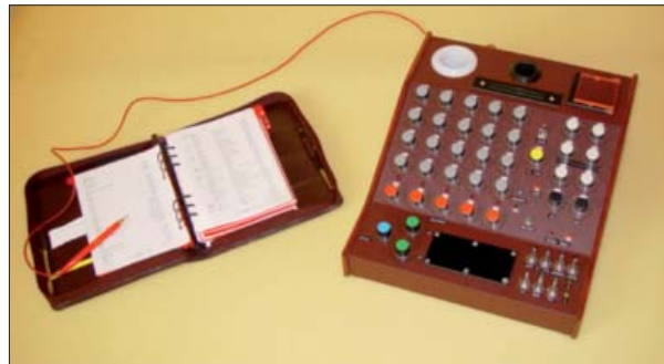
Die Gerätekonfigurationen sind eine Frage der Zeitverfügbarkeit. Wenn jemand auf seine eigene Wahrnehmung großen Wert legt und die Zeit pro Klienten ausreichend zur Verfügung steht, so ist die händische Analyse eine gute Variante. Will ein Radioniker die Vorteile eines händischen Gerätes in Kombination mit der EDV nutzen, so kann das ASLD 95 - ein Sondermodell unseres Institutes - mit einem Interface ausgestattet werden, und es kann in Verbindung mit einem Computer das EDV-Programm Scope seine Dienste leisten. Der Vorteil des ASLD 95 ist, daß dieses Gerät auch dann noch funktioniert, wenn einmal der Strom oder die EDV ausgefallen ist.

Eine Überfunktion signalisiert die Zustandsmöglichkeiten akut, zuviel, entzündlich oder Yang.