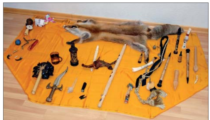
Im Bild links sehen wir eine Spiral-Mesa, wie sie für Meditationen oder Reisen verwendet wird. Im rechten Bild ist ein Altar, der im Rahmen einer Bellian-Zeremonie aufgebaut wird. Die Kraftobjekte folgen einer bestimmten Ordnung.

Eine BELLIAN-ZEREMONIE bezweckt die rituelle Heilung eines Einzelnen oder einer ganzen Gruppe. Der Aufbau ist der einer Mysterien-