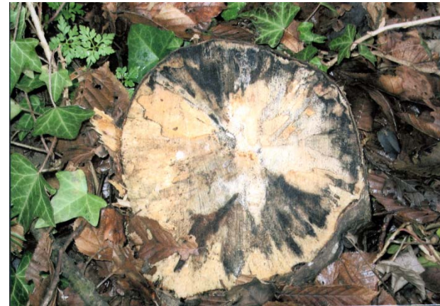
Bild oben: A. nimmt im Baumstumpf eine Engelsform wahr. Sie bereist den Baumstumpf und erzählt die Geschichte der jungen Gräfin.

Bild links: Der Hirsch ist der Träger der Ganzheit, der Kraft aus dem Licht. Er trägt sein Geweih wie einen großen Trichter (Krone) auf dem Kopf, worin er die Geschenke des Universums einfangen kann.