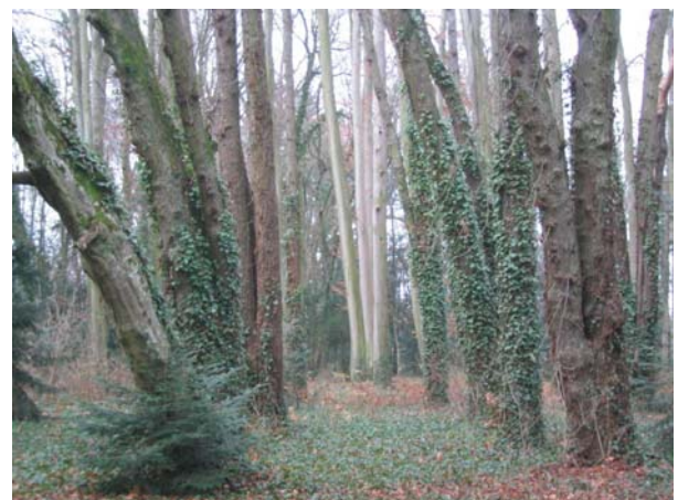
Die „silbernen Bäume“ in der Mitte des Bildes zogen die Aufmerksamkeit von Ch. auf sich.

In R. ist vor vielen Jahren ein Krieg gewesen, und in dieser Zeit hat der Wald gebrannt. Die Tanne ist damals noch ein kleiner Same gewesen und die Blaumeise war noch ein Ei. Aus dem Samen ist die Tanne gewachsen, die Blaumeise ist geschlüpft. Eines Tages sind Jäger gekommen, die haben den Baum fällen und den Vogel abschießen wollen. Es ist ihnen aber nicht gelungen, weil ein Licht gekommen ist, das die Tanne und die Blaumeise beschützt hat. Das Licht war ein besonderes Licht, es war ein Schein und der hat die Kraft gehabt, dass nichts im Umfeld des Lichtes zerstört werden können. Das R. Schloss hat viel Schaden genommen im Krieg, durch den Lichtschein hat es aber viel geregnet und alles ist wieder gewachsen und war normal.