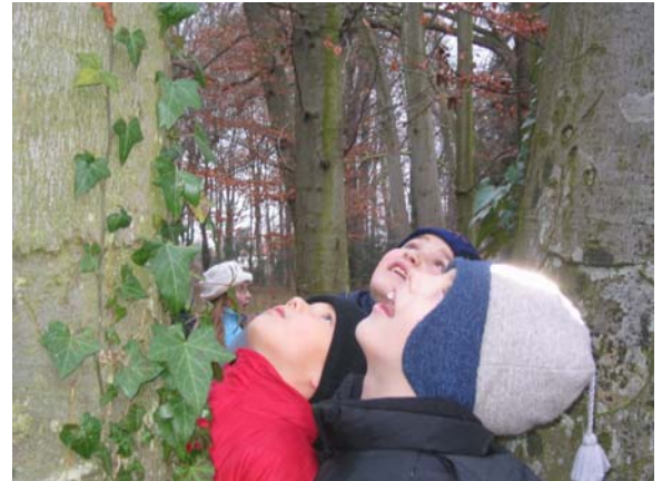
Kognitive, emotionale und spirituelle Fähigkeiten erwerben Kinder in der Natur, und gleichzeitig verlieren sie den negativen Beigeschmack.

In einem modernen pädagogischen Werk zum Thema Lernen aus systemischer Sicht schreibt die Autorin: „Es sind die SchülerInnen in ihrer Ganzheit und in all ihren Erfahrungsdimensionen zu berücksichtigen. SchülerInnen, als sich entwickelnde bio-psycho-soziale Systeme definiert, benötigen dementsprechend kognitive, emotionale, sinnliche, motorische und spirituelle Anregungen. Ferner ist zu befürworten, sich als LehrerIn nicht nur auf fachliche bzw. funktionale Vermittlung von Kenntnissen zu beschränken, sondern eine umfassende Persönlichkeitsbildung anzustreben, die sowohl das Denken, Sprechen, Verstehen, Fühlen, Einfühlen und das bewusste Handeln impliziert. Zur Bewältigung ganzheitlicher, komplexer Aufgaben sind zum Beispiel kognitive und emotionale Fähigkeiten wie Empathie, Selbstregulierung von Aggression ebenso bedeutsam wie spirituelle Fähigkeiten, etwa Achtsamkeit, Ruhe, Aufmerksamkeit, Konzentration und Intuition. Hinzu tritt als übergeordnete Kompetenz eine spezielle Wahrnehmung, die visuelle Intelligenz, damit ist die Fähigkeit gemeint, Dinge auf mehrere Arten wahrzunehmen bzw. zu beobachten.“ (Mikula Regina, Das komplexe Netzwerk pädagogischer Welten-Bildung, Studienverlag 2002)