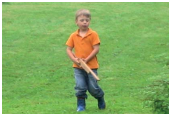
Nach der Behandlung kann nun ein weiterer Aspekt, nämlich der „Draufgänger“ in der Natur, uneingeschränkt gelebt werden.

Loslassen des Bedürfnisses nach ständiger Absicherung und Unterstützung durch eine andere Person wird erleichtert.