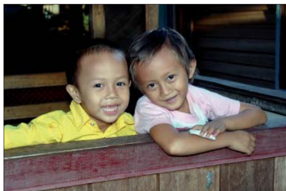
Fröhliche Kindergesichter gewährleisten der Elterngeneration einen gesicherten Lebensabend.

Diese drei Etappen umfassen die Zeit des Kindes und des Jugendlichen bis zum Erwachsen-Werden. Auf die weiteren Alterskategorien werde ich in den nächsten Folgen näher eingehen.