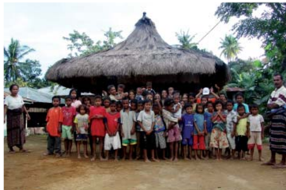
In den Dörfern abseits der Zivilisation lebt noch die Dorfgemeinschaft: Kinder haben eine Familie und sind auch noch gut in das Dorfleben eingebettet.

Die dritte Etappe von 14 – 21 Jahren umfaßt die Zeit der Pubertät und die der Adoleszenz. Hier erfolgt der Durchbruch zur Wirklichkeit der Welt der Erwachsenen. Am