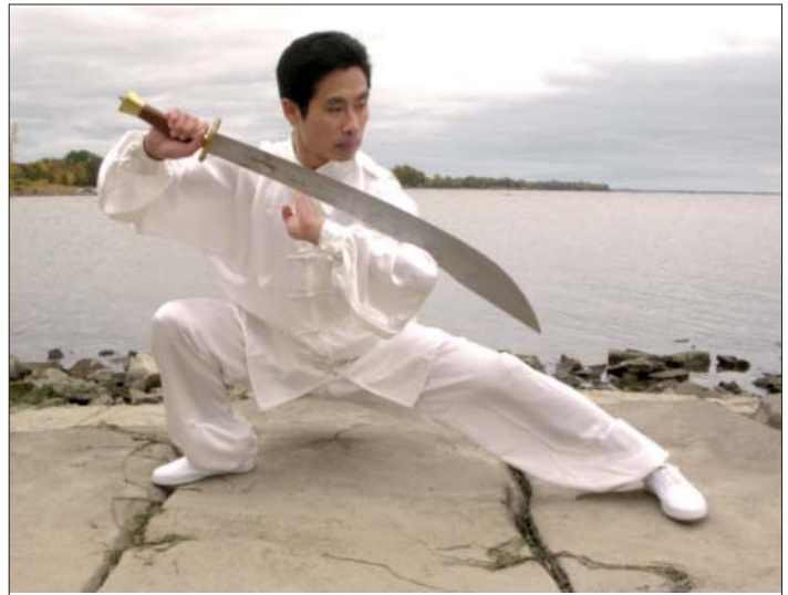
Abb.: Die Prinzipien des Baguazhang werden nach dem Erlernen der grundlegenden Handform und des Kreisganges auch auf Waffen wie Schwert, Säbel, Stock oder Hakenmesser übertragen.

Indem man diese verschiedenen Handkräfte übt, gelangt man zu einem tieferen Verständnis der Naturkräfte. Durch fortgesetztes Praktizieren schwingt der gesamte psycho-physische Organismus vermehrt im Einklang mit dem Dao.