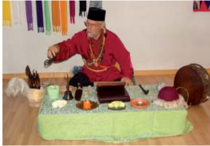
Aufladen der Kraftgegenstände als Vorbereitung für ein schamanisches Ritual

Erst ein Mensch, der seine Vision erfahren hat, ist fähig seinen Weg mit Herz zu gehen.