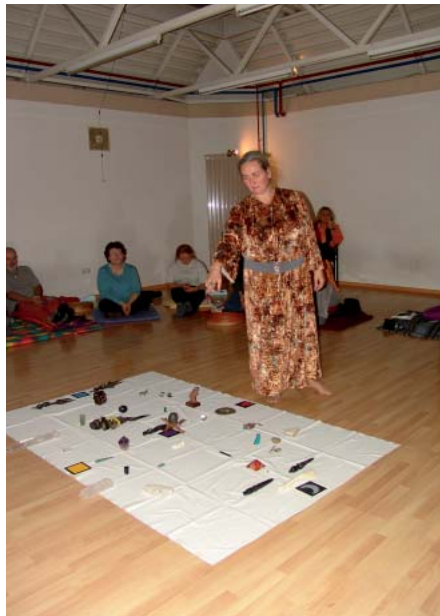
Mesa ist der heilige Raum des Schamanen. Sie stellt die gesamte Schöpfung dar, und so können in ihr auch Teilbereiche dargestellt werden. Die große Mesa, wie sie hier in diesem Foto dokumentiert ist, ermöglicht es, in Bereiche Einblick zu nehmen, die dem alltäglichen Blick verborgen bleiben. Hier können Informationen abgerufen werden, die für den Lebensweg des Fragenden von entscheidender Bedeutung sind. Der Aufbau der Mesa ist der Absicht entsprechend, mit der eine Mesa gelegt wird. So gibt es viele Möglichkeiten des Einsatzes.

der Mineralien, der Pflanzen und der Tiere, welche er im Zuge seiner Entwicklung durchgegangen ist, sind ebenfalls wichtige Unterstützer. Ihnen wohnt die spezielle Information und das Vermögen ihrer Welt inne. So können sie Fragen