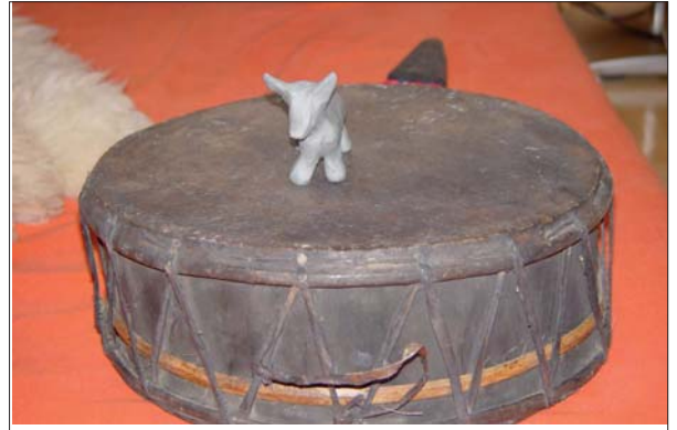
In der Lernhilfe kommen unterschiedliche Methoden zum Einsatz: Hier wurde nach einer schamanischen Reise das Krafttier aus Ton geformt, das den Schüler zu Hause täglich an seinen Weg erinnert. Foto Mittel

Wenn ich im Vergleich dazu die Erziehung unserer Kinder ansehe, fällt auf, dass wir ebenso wie die Aborigines uns viele Gedanken machen und viel Zeit und Geld investieren, um die Überlebensfähigkeit unserer Kinder gewährleisten zu können. Es fehlt also durchaus nicht am Willen und den Bemühungen. Unser Problem scheint zu sein, dass wir nicht wissen, wohin wir mit unserer Erziehung wollen. Es fehlt uns mittlerweile an Werten und Normen, die uns gemeinsam als richtungsweisend und wertvoll erscheinen – die Anschauungen unter den Menschen in unserer Gesellschaft variieren beträchtlich. RadionikerInnen werden bestätigen, wie häufig Imbalancen im Bereich des Wurzelchakras sowohl bei Kindern als auch bei